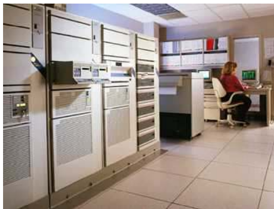
Slika 3: ... (Vir 2003)

Za vse citate oziroma uporabo idej iz literature vedno navedemo vir. Vire v besedilu navajamo na enega od naslednjih načinov: